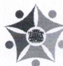
JORGE LUIZ SANTIN Prefeito Municipal

PREFEITURA MUNICIPAL BARRACÃO DE MÃOS DADAS COM O POVO