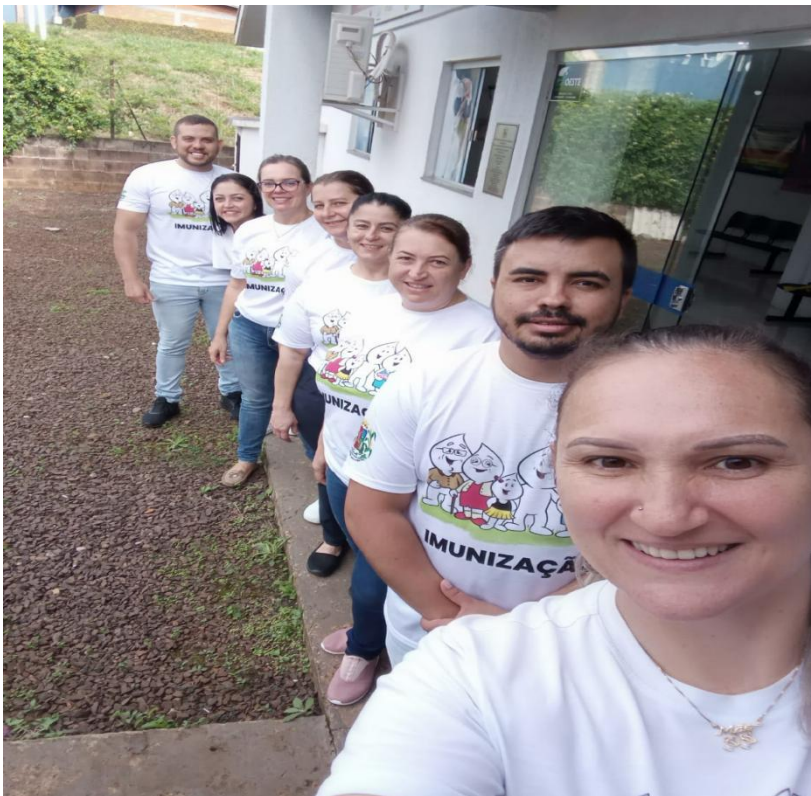
Entrega de camisetas para atividade de vacinação para toda a equipe de enfermagem, Agentes Comunitários de Saúde e Zeladoria