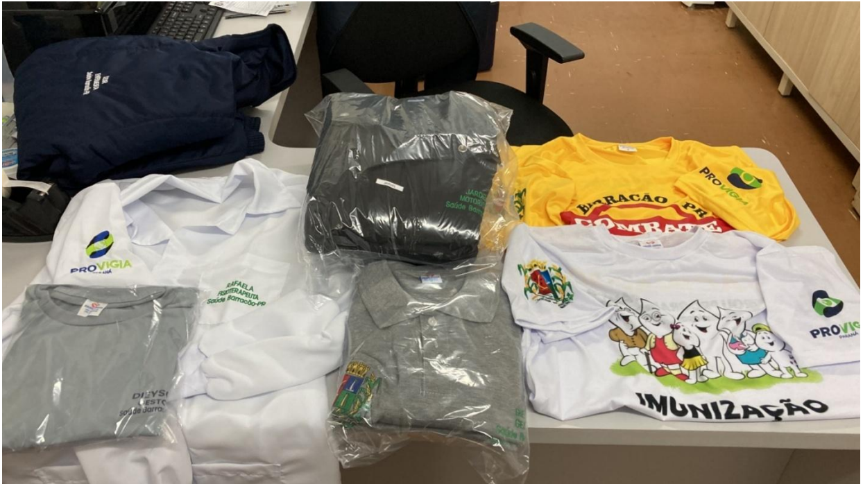
Entrega de uniformes para Equipe de Saúde PROVIGIA 2023