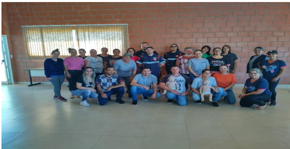
Treinamento do SAMU Primeiros Socorros ESF Industrial e Agentes de Saúde em fev/23