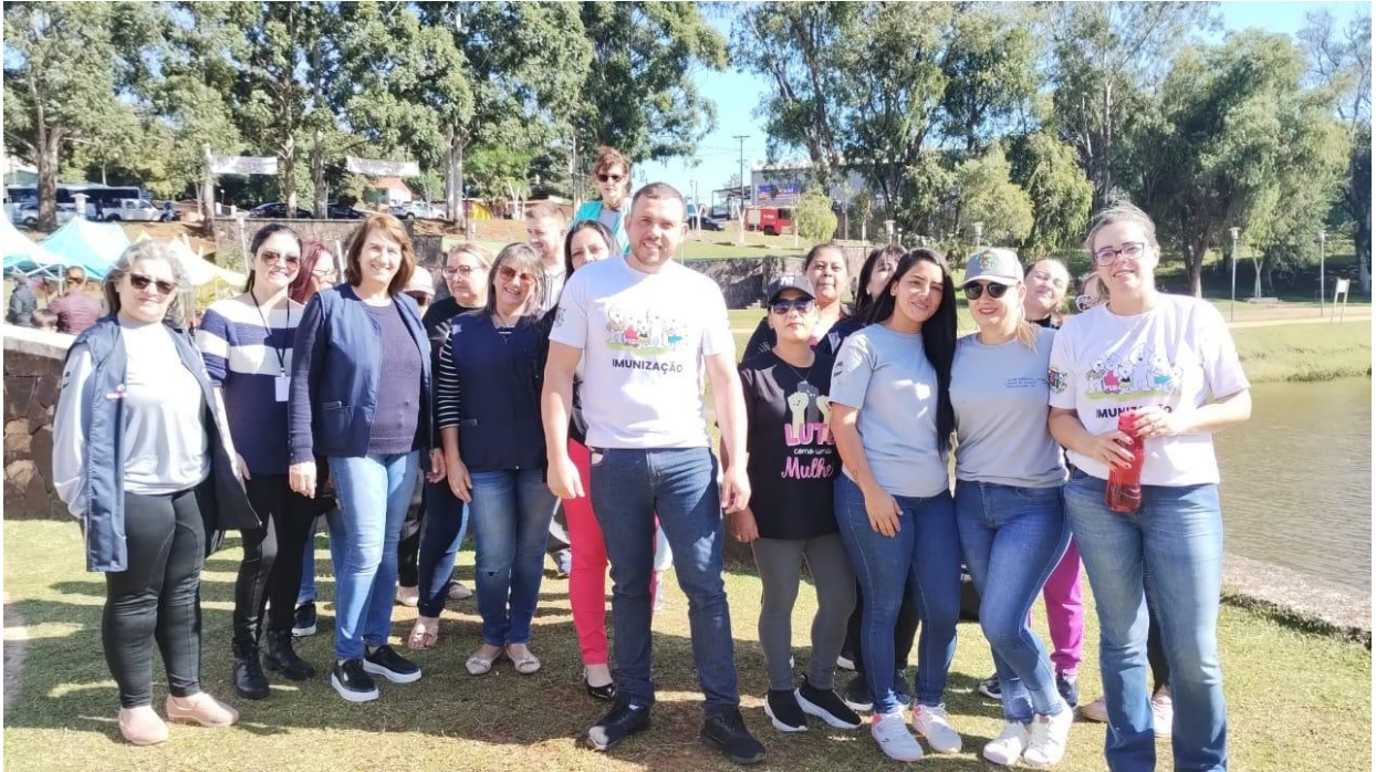
Semana de vacinação das Américas. Lago internacional dia 24/04/23