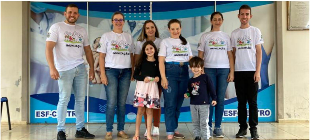
Dia D vacina da gripe 15/04/2023