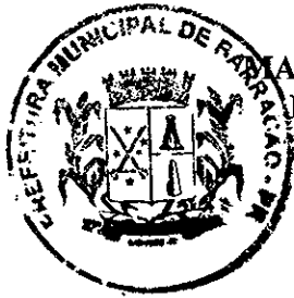
MARCO AURÉLIO ZANDONÁ PREFEITO MUNICIPAL